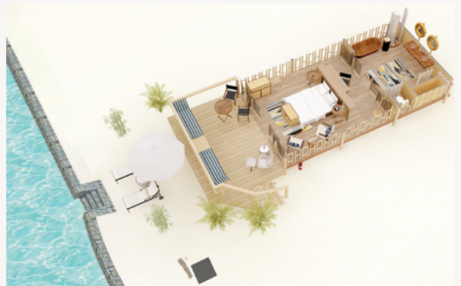
SUITE TIENDA DE CAMPAÑA FRENTE AL MAR