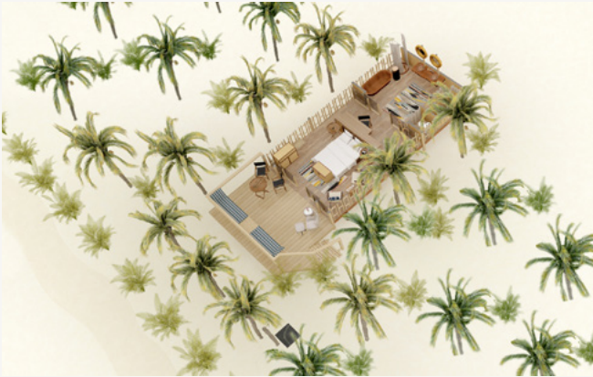
SUITE TIENDA DE CAMPAÑA EN LA PLAYA