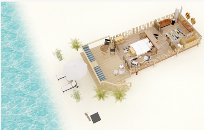
SUITE TIENDA DE CAMPAÑA EN LA PLAYA