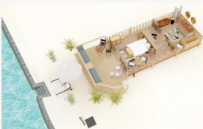
СЮИТ С ШАТРА НА БРЕГА НА ОКЕАНА