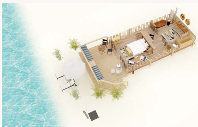
СЮИТ С ШАТРА И ПЛАЖ