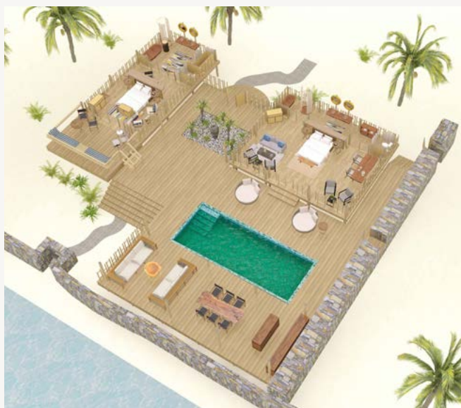
DELUXE POOLVILLA MED TO SOVEVÆRELSE