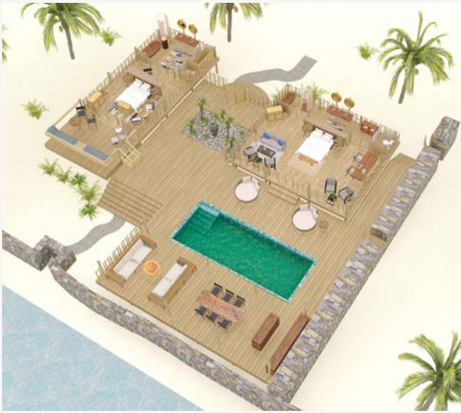
VILLA CON PISCINA DE LUJO DE DOS HABITACIONES