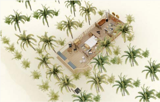
SUITE TIENDA DE CAMPAÑA EN LA PLAYA