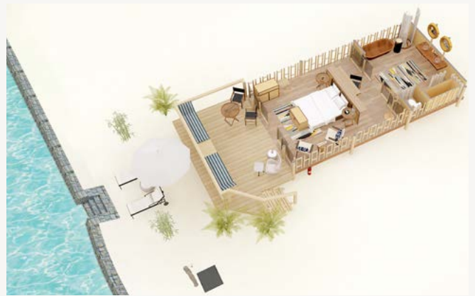
SUITE TIENDA DE CAMPAÑA FRENTE AL MAR