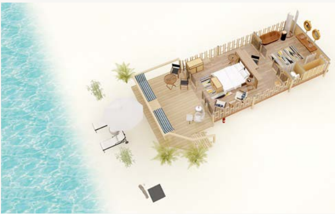
SUITE TIENDA DE CAMPAÑA EN LA PLAYA