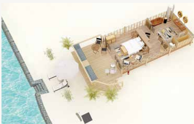
СЮИТ С ШАТРА НА БРЕГА НА ОКЕАНА