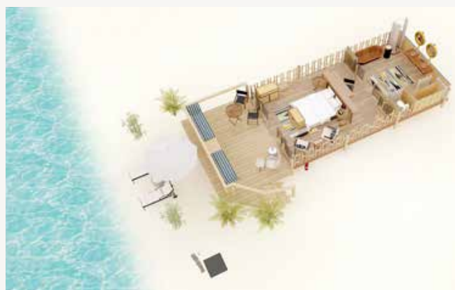
СЮИТ С ШАТРА И ПЛАЖ