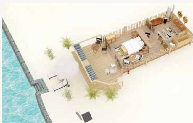
TELSUITE VED HAVET