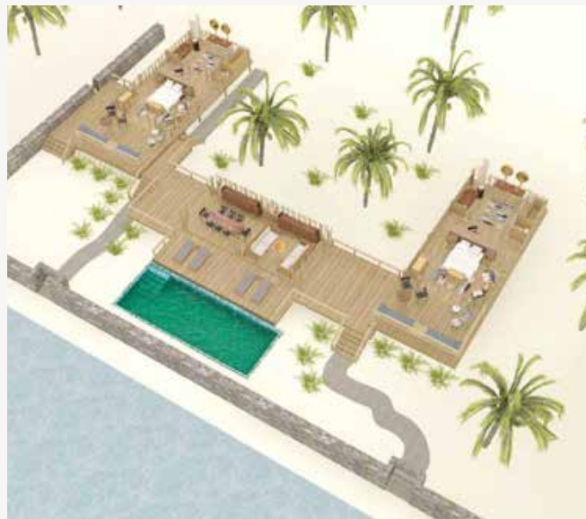
DWUPOKOJOWA WILLA Z BASENEM INFINITY