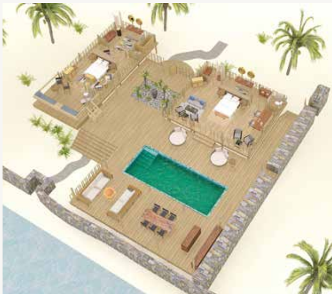
DWUPOKOJOWA WILLA DELUXE Z BASENEM