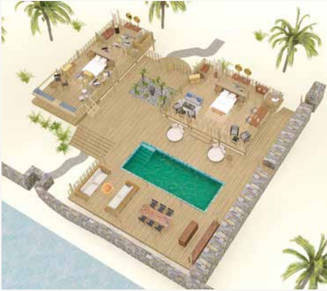
VILLA CON PISCINA DE LUJO DE DOS HABITACIONES